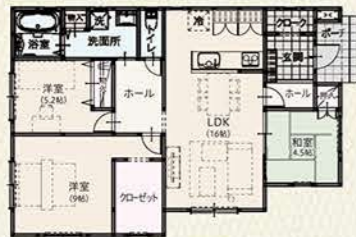
参考プラン 区画 No.1

3LDK 26坪 土地価格 960万円 + 建物価格 1,420万円(税込) 参考価格 2,380 万円(税込)