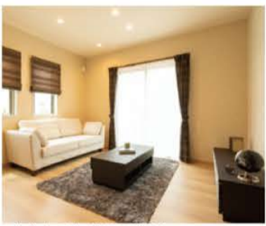
モダンなインテリアが映えるリビング