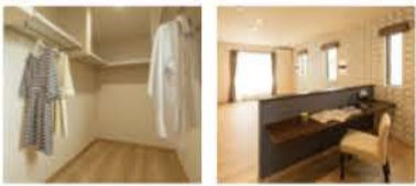
4.5帖のクローゼット 自分時間を楽しむ書斎スペース