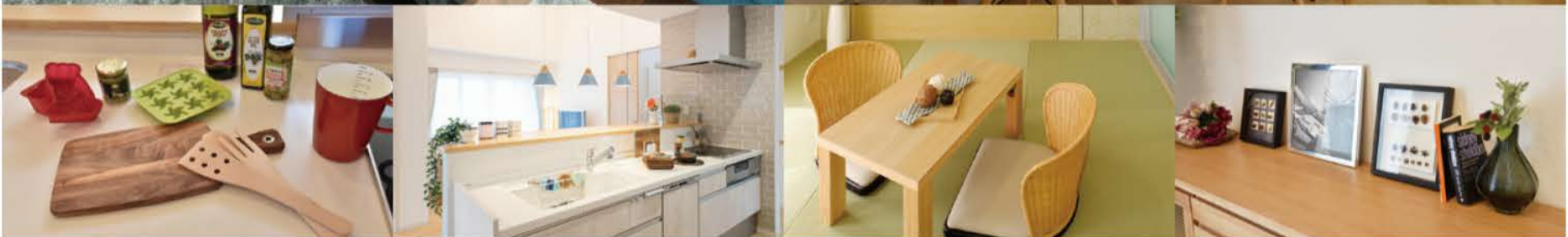
※上記写真はイメージです。 ※下記は平成30年7月4日に撮影したものです。