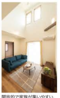
開放的で家族が集いやすい吹き抜けリビング

No. 12 4LDK 敷地面積：210.30㎡(63.62坪) 延床面積：118.21㎡(35.76坪) 1F：59.83㎡(18.09坪) 2F：58.38㎡(17.66坪) 3,390万円